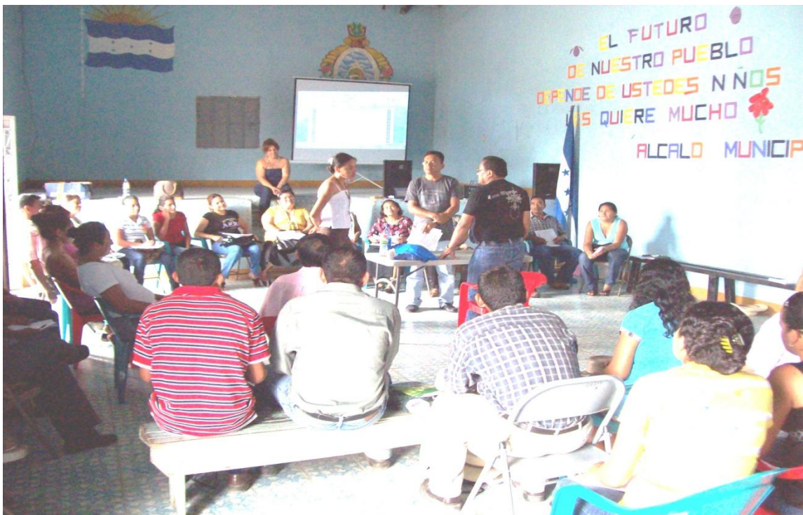
Participando en socio drama sobre la aplicación de la ficha.

Para llevar a cabo esta Auditoría Social se capacitó a los padres y madres de familia en el manejo de la ficha elaborada para ella. La ficha tenía como objetivo principal verificar en cada centro educativo la lista de maestros presentes, las jornadas en que laboran o las materias que imparten y compararla con la información de Escalafón y la Dirección Departamental. Además permitió conocer la matrícula de alumnos desagregados por sexo, identificar los hallazgos y recoger algunas observaciones. La ficha utilizada tiene como característica levantar solo información verificable en el centro educativo no pretende recoger información específica sobre causas de traslados, estatus legal o situación salarial (Anexo I).