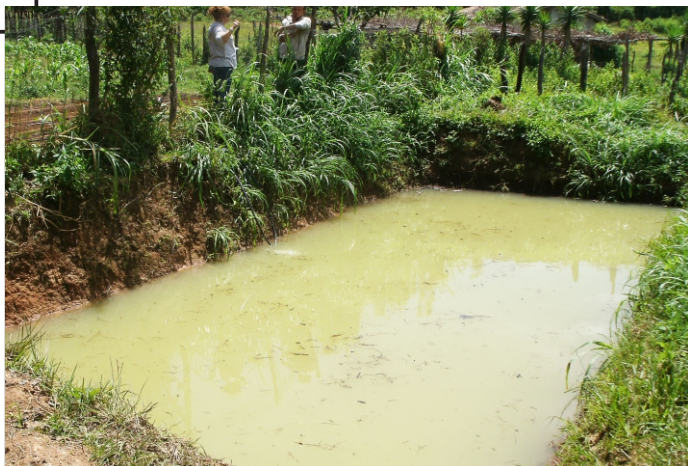
Estanque para siembra y crecimiento de alevines