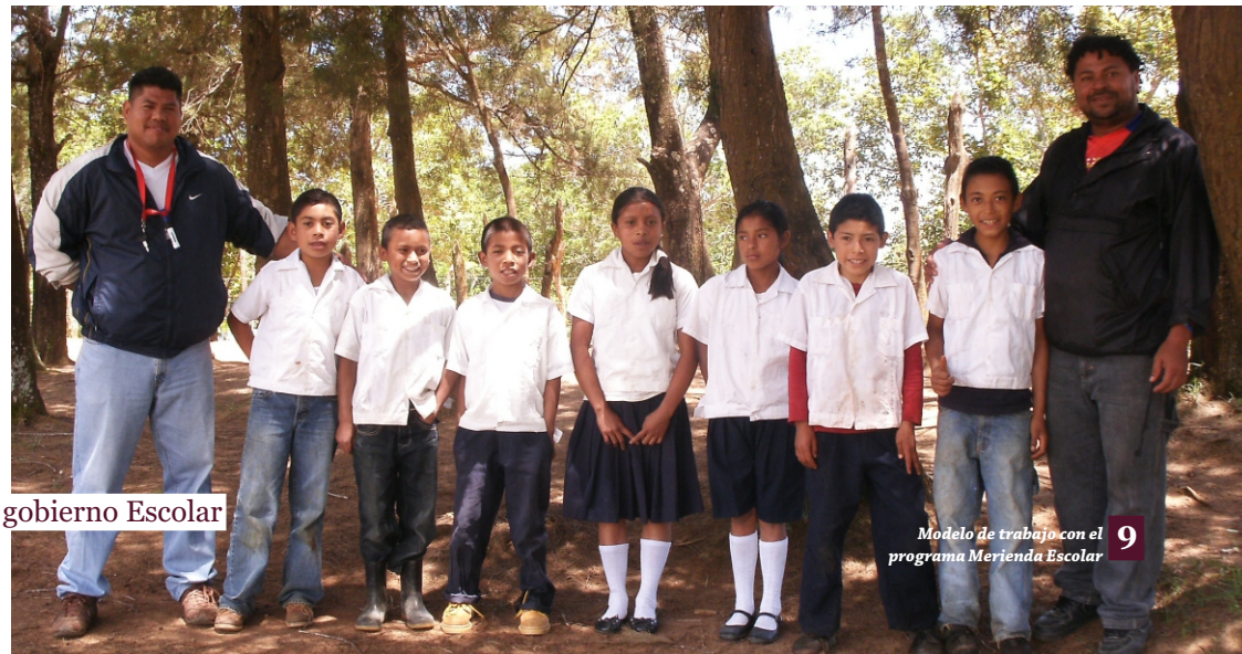
El gobierno Escolar