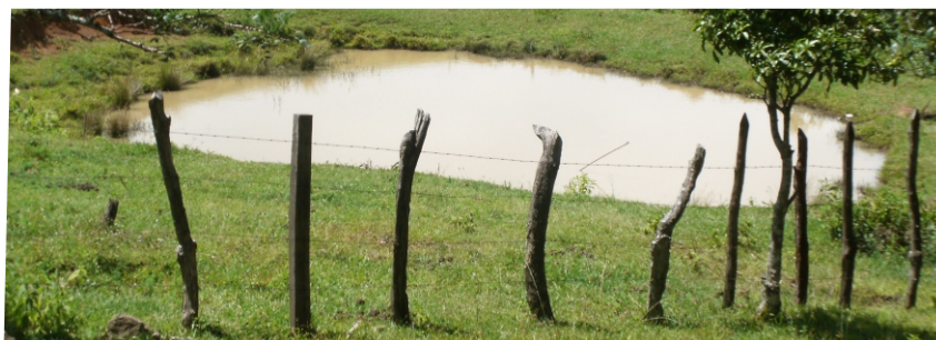
Estanque para engorde y mantenimiento

El primer estanque sirve para hacer crecer los alevines y el segundo para engorde y mantenimiento.