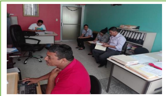
Monitoreo del TPA en su proceso de ejecución en el CEM Lorenzo Cervantes.