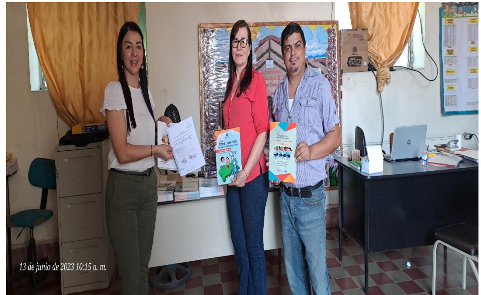
Entrega de manuales "Con Transparencia Ganamos Todos y Todas"