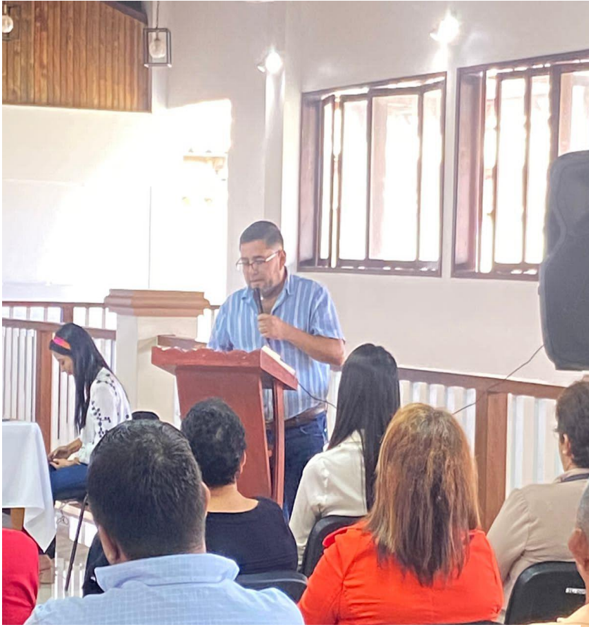
Monitoreo y Avances del Sistema de Supervisión y Acompañamiento Docente (ODK) Coord. Lic. Darwin Sandoval