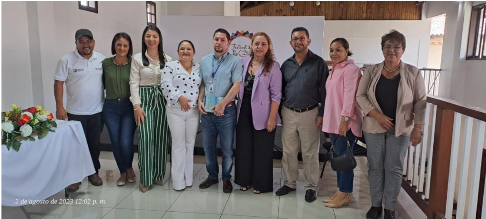
Equipo Técnico Departamental de Educación y Autoridades Departamentales