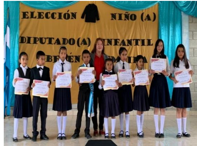
Elección de Congresista Infantil